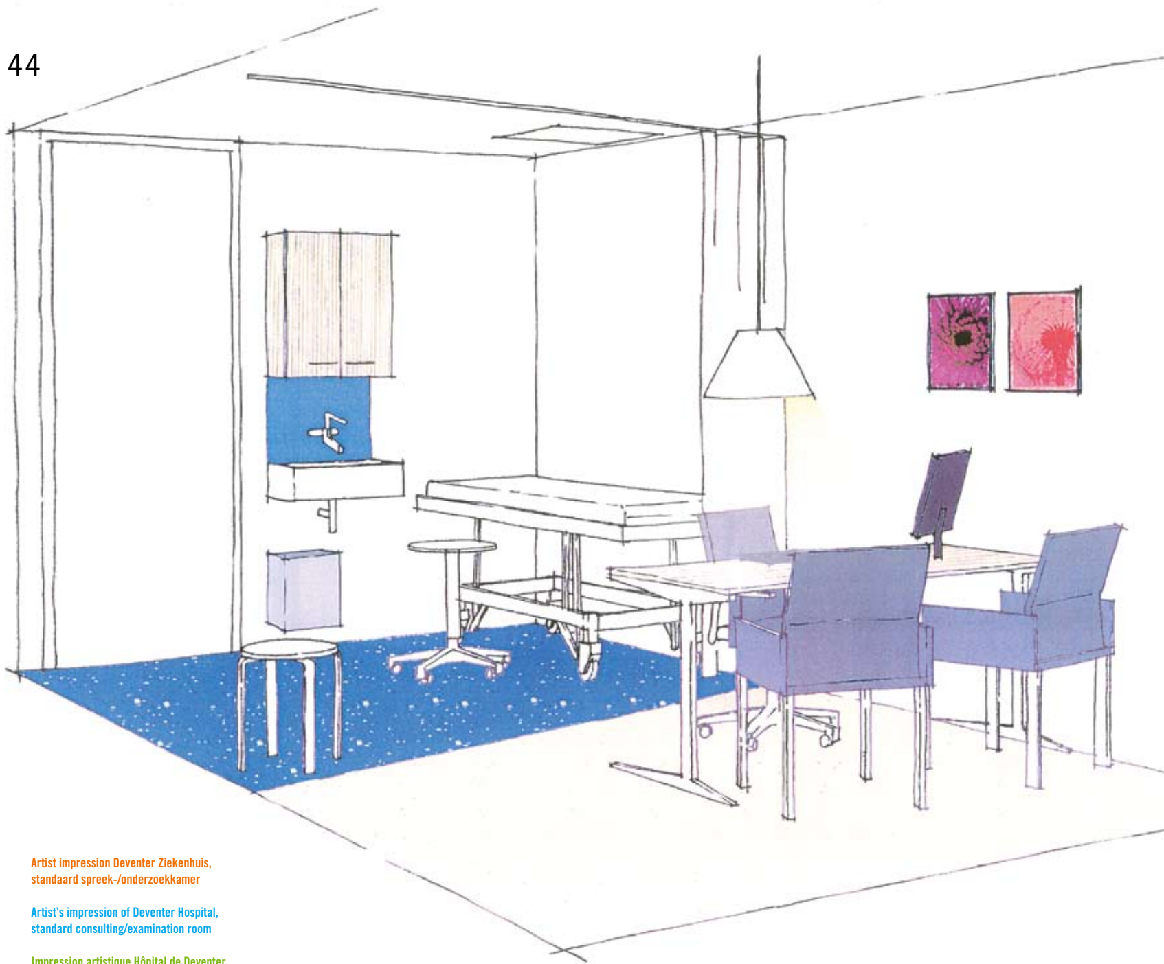
Artist impression Deventer Ziekenhuis, standaard spreek-/onderzoekkamer