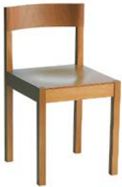
No Sign of Design

à des fonctions diverses : des tables que l'on peut utiliser en position assise, couchée ou debout. Pendant sa dernière année d'études, Hutten a lancé son propre studio. Il s'est fait un nom avec des concepts ludiques et originaux tels que No sign of design et Table upon table, des concepts qui lui ont permis également de percer sur la scène internationale. Son fauteuil S(h)it on it (un petit siège en forme de croix gammée) a été conçu contre le fascisme, mais il a été mal interprété à Brême où il fut maculé et provoqua des troubles politiques. Sa table The Cross a également suscité des réactions très diverses. Hutten a participé dès le début à Droog Design et il est ainsi l'un des grands représentants du Dutch Design. Ses créations limpides et souvent humoristiques lui ont permis d'obtenir en Asie (au Japon et en Corée) un statut de star. Une école portant le nom de Hutten sera inaugurée à Séoul en 2010. Sur la scène internationale, Hutten est considéré comme l'un des plus éminents designers du moment. Des œuvres de Hutten se trouvent dans les collections de nombreux musées, entre autres du Stedelijk Museum Amsterdam, du Museum of Modern Art, du Vitra Museum et du San Francisco Museum of Modern Art. Au nombre des fans célèbres de l'œuvre de Hutten se trouvent: Karl Lagerfeld, Philippe Starck et la reine Beatrix des Pays-Bas. Ouvrage le plus récent: RICHARD HUTTEN – Works in use.