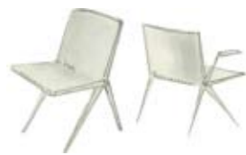
Schets Mondial stoel