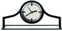
Outline klok laag