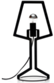
Outline tafellamp small 38 cm