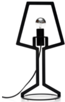
Outline tafellamp medium (53 cm)